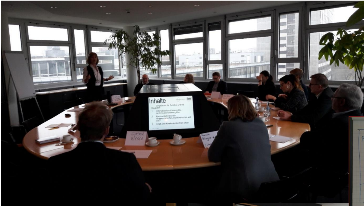
CANVAS Geschäftsmodell, Segmentierung in Business Units